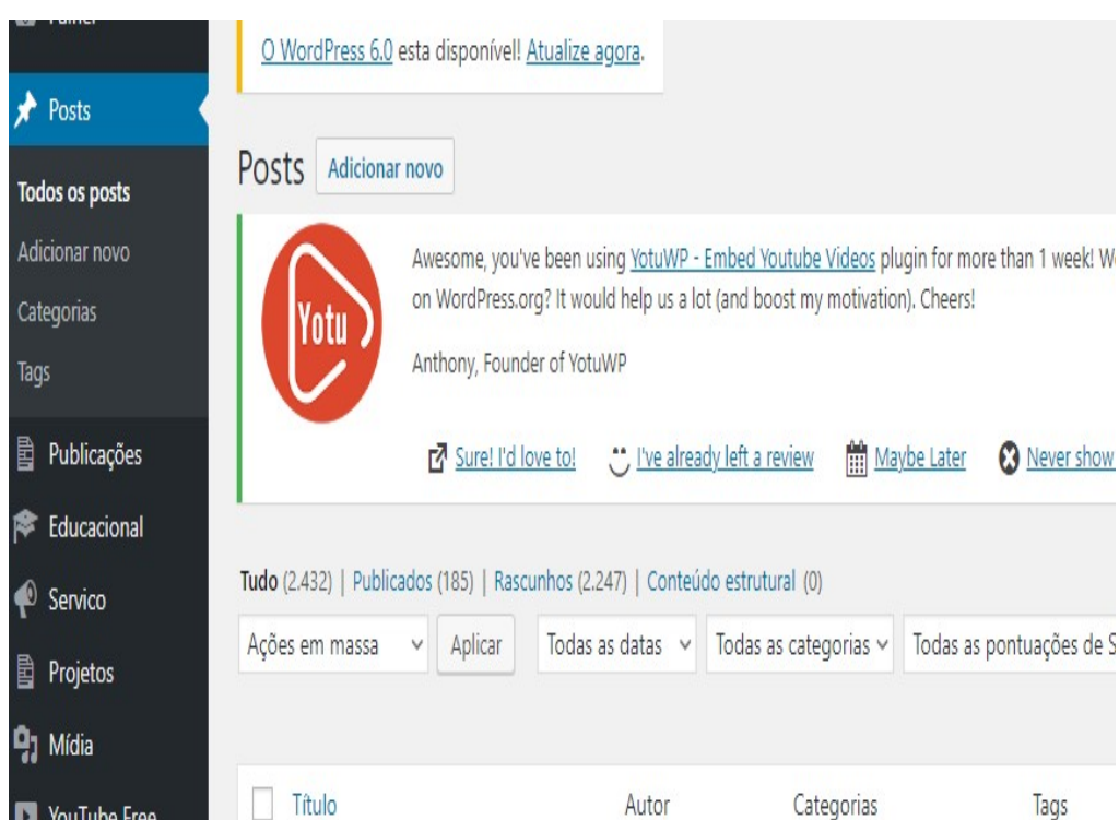
Figura 4: Página Postagem - Wordpress (2023)

Periodicamente ocorre a postagem de diversos artigos da Pós-graduação do INPE, congressos, publicações em revistas, papers dentre outros documentos, para isso foi utilizado a área de publicações do Wordpress, no qual é possível gerar links para o site de publicações geradas pelo o INPE.