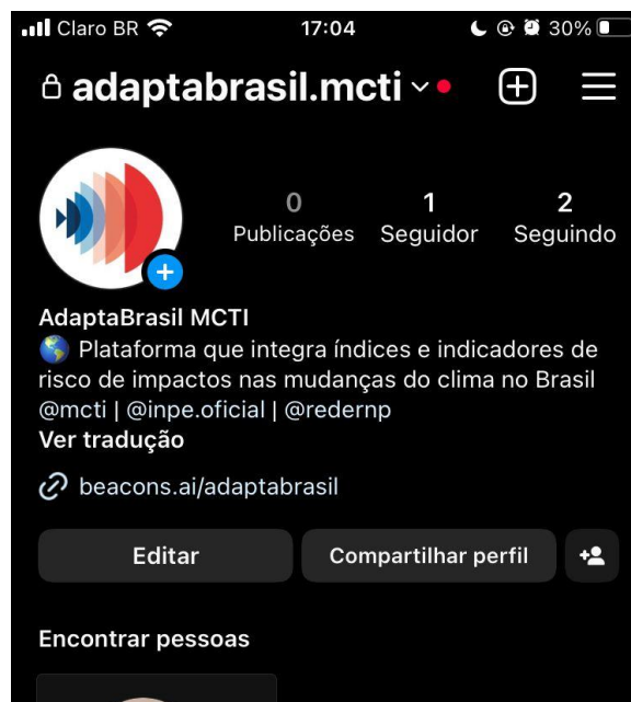
Figura 3: Página do Instagram do AdaptaBrasil MCTI.