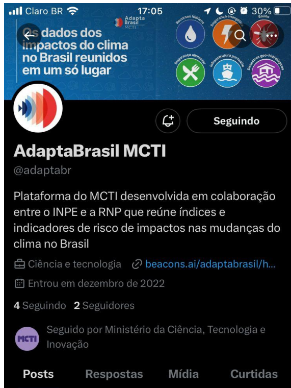
Figura 2: Página do Twitter do AdaptaBrasil MCTI.