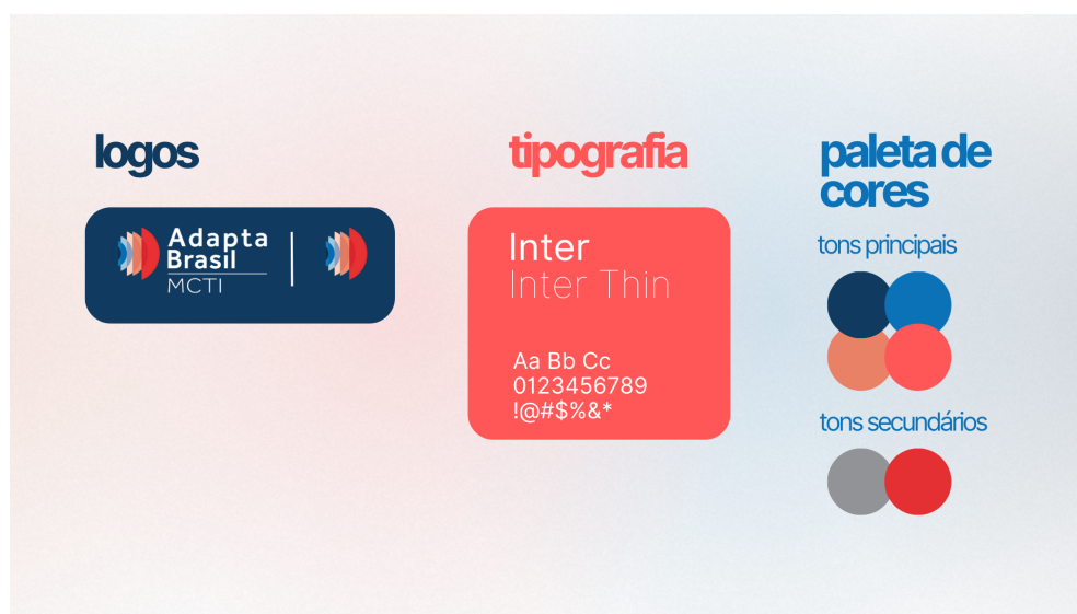
Figura 1: Logo, tipografia e cores a serem usadas nas Redes Sociais.

A Figura 1 consolida todas as informações apresentadas nesta seção.