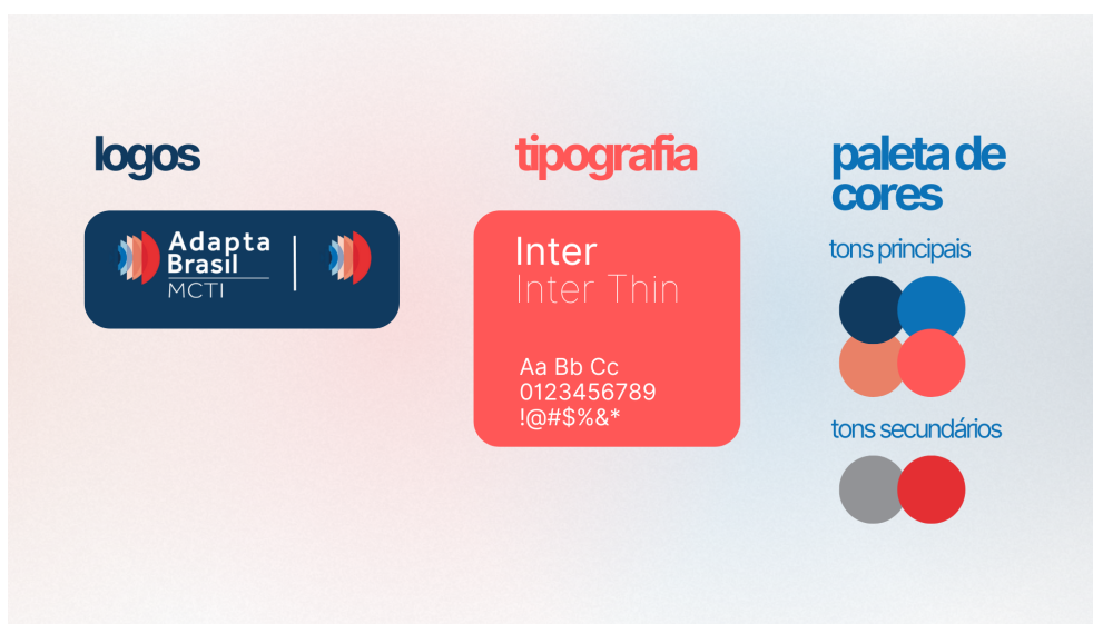
Figura 1: Logo, tipografia e cores a serem usadas nas Redes Sociais.

A Figura 1 consolida todas as informações apresentadas nesta seção.