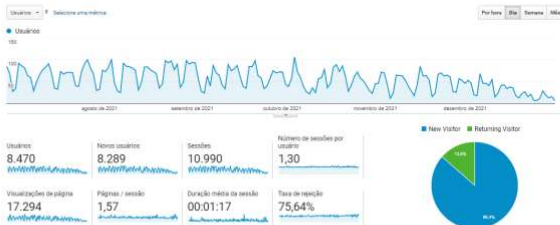
Figura 1: Dados de acesso de usuários no período do segundo semestre de 2021.