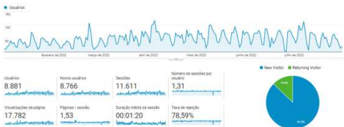
Figura 2: Dados de acesso de usuários no período do primeiro semestre de 2022.