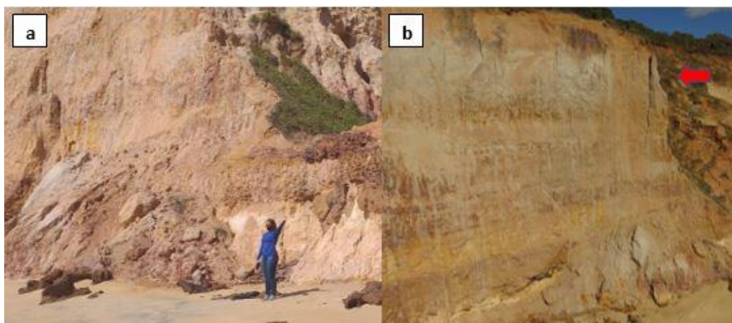
Figura 3: Movimentos de massa nas falésias de Barra de Tabatinga/RN.

a) Movimentos de massa e acumulo de talus na base; b) fendas de tração no topo da falésia.