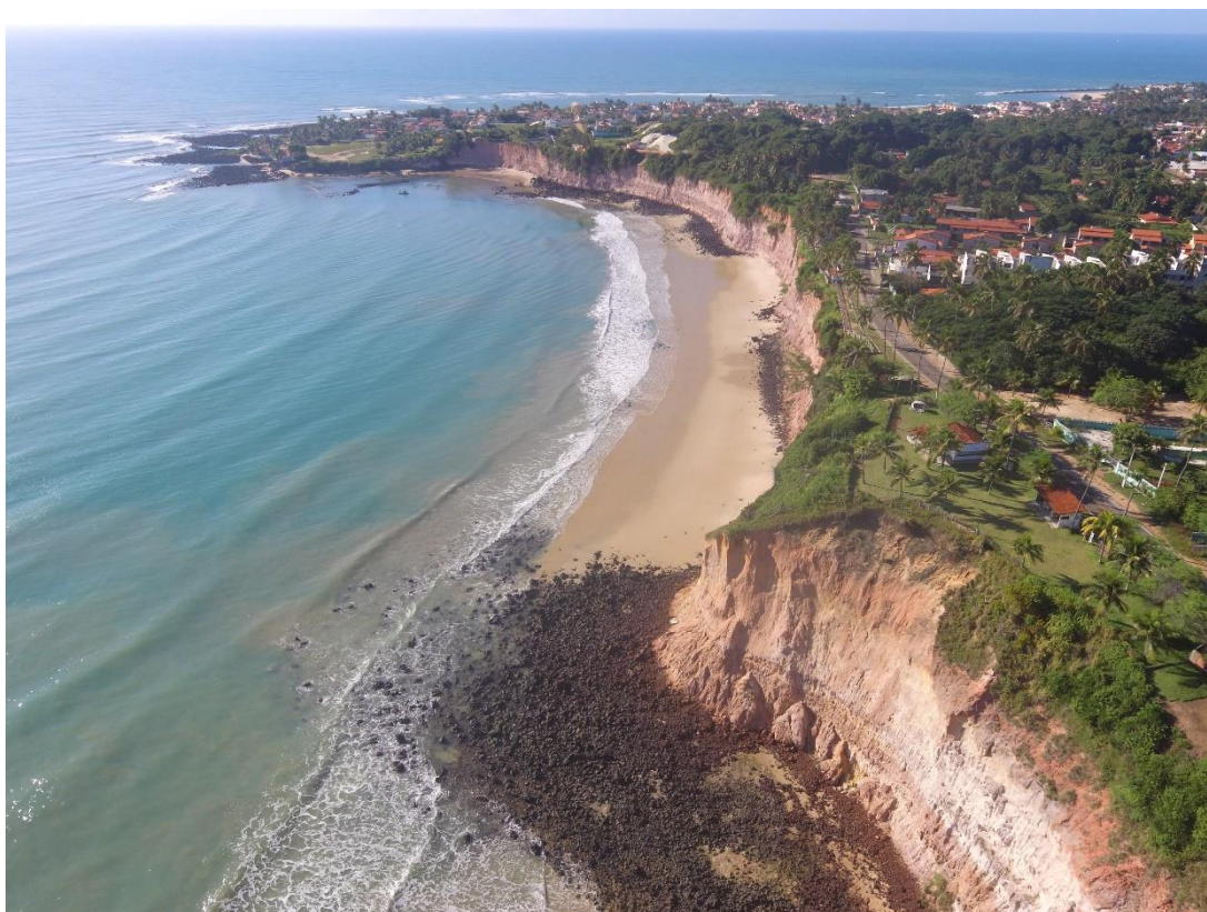
Figura 1: Foto aérea da falésia da Barra de Tabatinga, litoral oriental do RN.