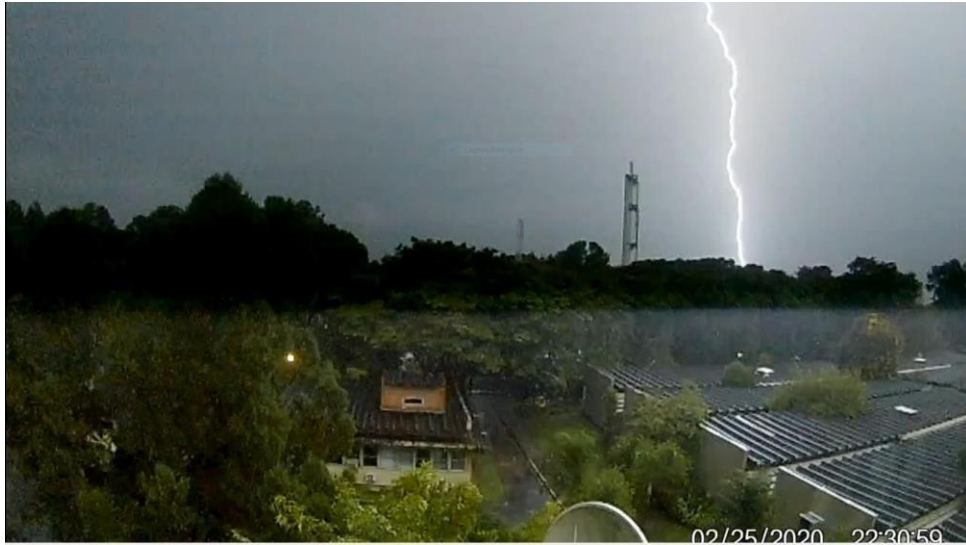
Figura 3.2 – Imagem de raio descendente obtida pela Eken H9R.