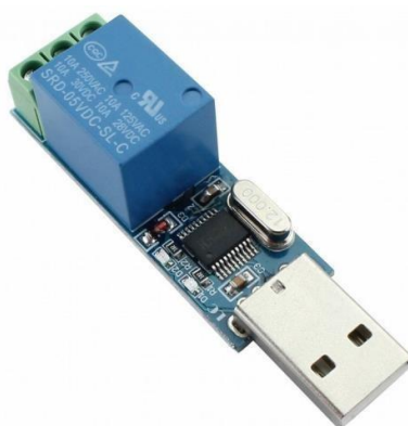
Figura 2.7 – Módulo relé com conversor CH340.

Com o módulo relé com entrada USB e conversor CH340 (Figura 2.7) é possível controlar a posição do contato do relé através de comunicação serial que pode ser feita entre um PC e o próprio módulo.