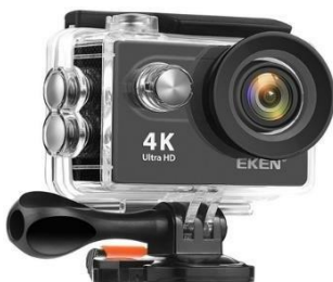
Figura 2.6 – Câmera de vigilância Eken H9R.

Como se mostra necessário uma forma de adquirir dados de vídeo em maior detalhamento dos que provém dos sistemas de vigilância, aderiu-se a ideia de fazer o uso de uma GoPro ou de um semelhante que seja capaz de gravar em definição HD a 120 FPS. Esse formato de gravação promete ser capaz de gravar vários quadros do momento de conexão embora não garanta detalhes do caminho da descarga como as câmeras de alta velocidade. Foi utilizada uma Eken, modelo H9R (Figura 2.6) na sala de monitoramento para gravar as tempestades numa resolução de 720p à 120 FPS.