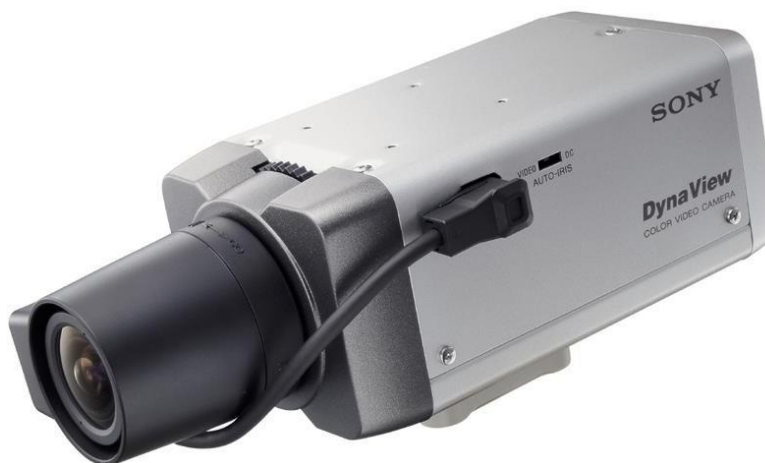
Figura 2.3 – Câmeras de vigilância (Sony, modelo SSCDC573).