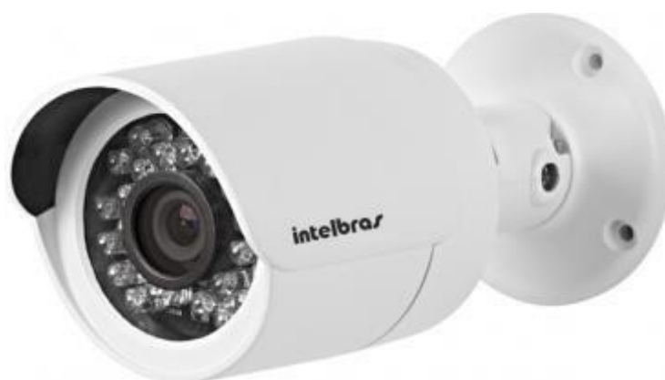
Figura 2.2 – Câmera de vigilância (Intelbras, modelo VIP S3330 G2).