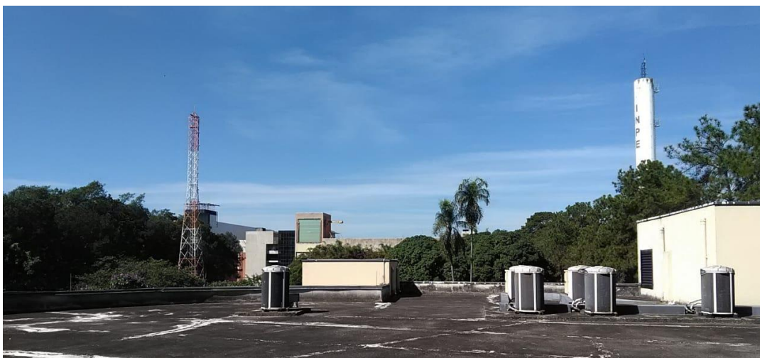
Figura 2.1 – Torres localizadas no interior do INPE, monitoradas durante as tempestades.